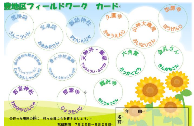
フィールドワークカード

例年、道徳公開授業のあとに行っている教育を語る会ですが、本校では「懇談会」, 「講演会」, 「地域巡り(親子で巡る豊地区フィールドワーク)」を3年サイクルで実施しています。今年度は「地域巡り(親子で巡る豊地区フィールドワーク)」を行います。夏季休業中(7月20日(土)~8月28日(水))の期間に親子で豊地区を歩くことで、豊地区を知り地域を愛する心を育てていってほしいと思います。それに先駆け、7月16日(火)に出発の会を行います。その中で各見学場所の見どころを紹介しますので、見学場所を決める参考になればと思います。夏休み前には資料と豊地区フィールドワークカードを持ち帰りますので、是非無理のない範囲での取組をお願いします