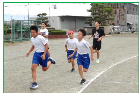
後ろから6年生を指導する中学生