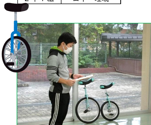
いただいた一輪車の披露

一輪車の練習は、身体の調整力や巧緻性を高めます。やる気や意欲を生み出すことにもつながります。一輪車に乗れるようになるには、年齢×3時間の練習が必要だと言われています。なわとびもそうですが、小学校のうちから積極的にチャレンジし、体力向上に取り組んでほしいと願っています。