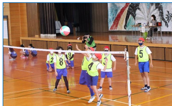
球技会 トス→アタック