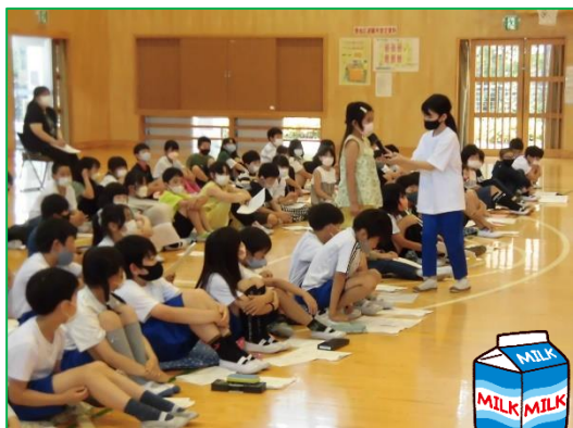
児童総会 意見発表

5月24日(火)、3年生以上の子どもたちで、児童総会を実施しました。本年度の児童会のテーマは、「Never give up ～みんなの最高の笑顔～」で、主な取組として3つの活動が位置付けられています。3つの活動は、子どもたちが覚えやすいように、YuTaKa(ゆたか)のYTKが頭文字になっています。